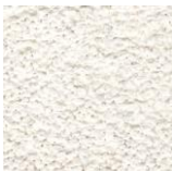
Blanc de la côte (de chez PRB ou similaire),

Teinte d'enduit autorisée pour les volumes principaux :