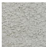
Carnac (de chez PRB ou similaire)