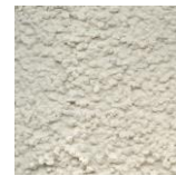
Ton Aquitaine (de chez PRB ou similaire)

Teinte d'enduit autorisée pour les volumes secondaires, les espaces entre deux portes fenêtres, des renforcements et autres éléments architecturaux