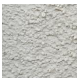
Gris Ouessant (de chez PRB ou similaire)

Teinte d'enduit autorisée pour les volumes secondaires, les espaces entre deux portes fenêtres, des renforcements et autres éléments architecturaux