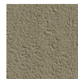
Cévennes (de chez PRB ou similaire)

Les maisons à ossature bois, avec parement (bardage bois ou composite), sont autorisées avec une teinte naturelle ou dans une couleur approchant les teintes d'enduit définies ci-dessus.